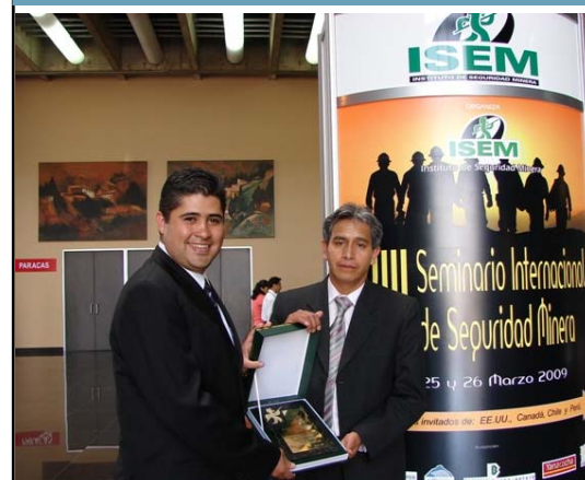
Un logro más para Minera Milpo, que compromete a todo el equipo de profesionales a continuar trabajando con eficiencia y responsabilidad.