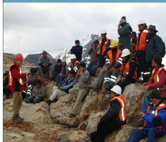
Personal técnico realiza mediciones en los frentes glaciares de los nevados de Chaupijanca Sur y de Shicra Shicra.