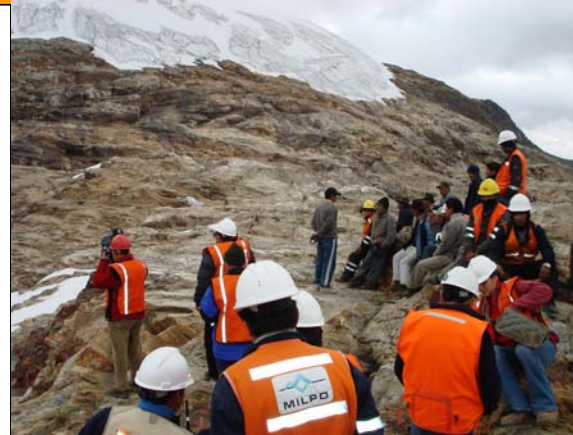
Trabajos de prevención ambiental en los Nevados de Chaupijanca y Gajap.

Adicionalmente y con el objetivo de mostrar siempre un trabajo transparente que permita al Proyecto Hilarión mantener un relacionamiento armonioso con las comunidades del entorno, se realiza de manera continua los monitoreos que verifican la calidad de aire, agua y suelo, a través de reconocidas empresas que son autorizadas previamente por el Ministerio de Energía y Minas.