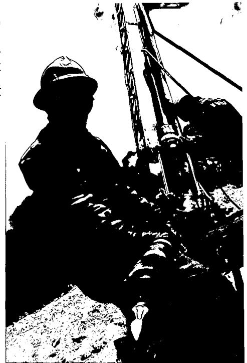
Exploración en las alturas del Perú

Por otro lado, señaló que siendo la minería una actividad cíclica, con fuerte impacto fiscal, el Perú tendría que trabajar para épocas de vacas flacas, es decir, la actividad tiene que manejarse con un concepto económico de gestión eficaz de costos y un uso más eficiente de la energía que permita ahorrar costos.